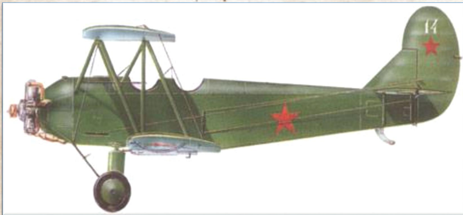
Самолет «По-2» (ночники).